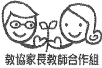
教協家長教師合作組

現在，你們可憑家教會家長委員的身份，申請「教協家教會卡」，以享用本會的多元化福利服務。